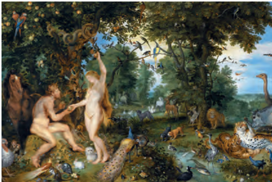
'Het aards paradijs met de zondeval van Adam en Eva', Jan Brueghel de Oude en Peter Paul Rubens, ca. 1612.

'Bij ons eerste thema: liefhebben. Direct in de zaal met het mooiste uitzicht.' Mijn gids stapt een rijk gedecoreerde zaal in en blijft staan voor een groot doek met een paradijsafbeelding van het allereerste stel.